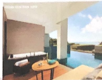
Gambar 2 Ocean View Pool Suite