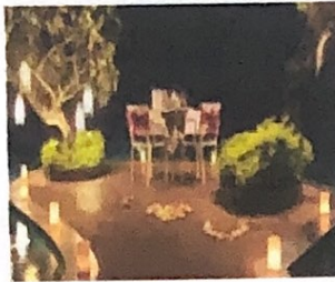
Gambar 2 Pool Island