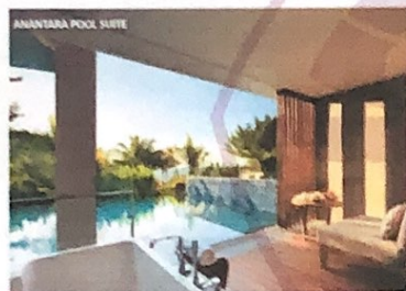
Gambar 3 Anantara Pool Suite