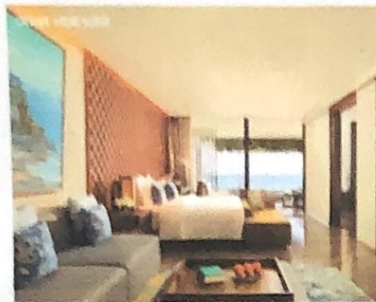
Gambar 1 Ocean View Suite