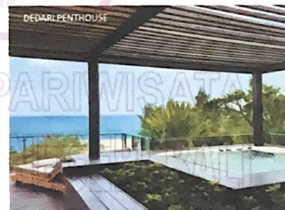
Gambar 12 Dedari Penthouse