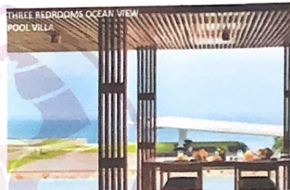
Gambar 10 Three Bedroom Ocean View Pool Villa