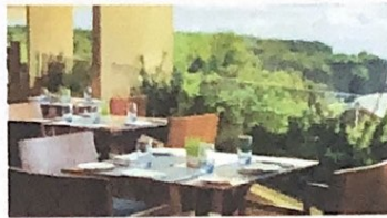
Gambar 1 360 Restaurant