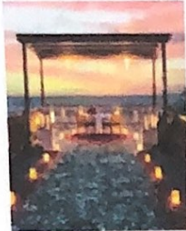
Gambar 1 Point Of View