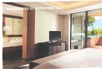
Gambar 8 Anantara One Bedroom Pool Villa