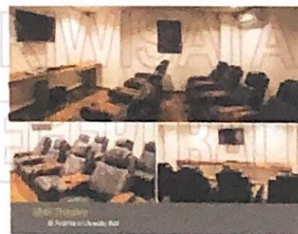
Gambar 8 Mini Theater