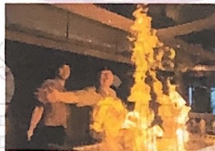
Gambar 3 Sono Teppanyaki