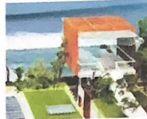
Gambar 3 Dewa Dewi Chapel