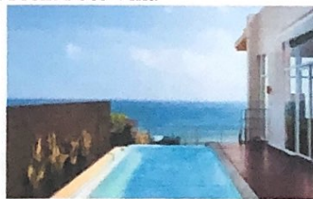
Gambar 13 Dewata Penthouse