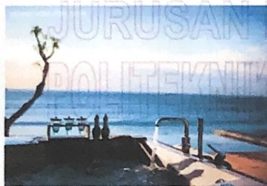
Gambar 5 Ocean Front Pool Suite