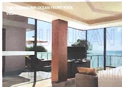
Gambar 11 Two Bedroom Ocean Front Pool Villa