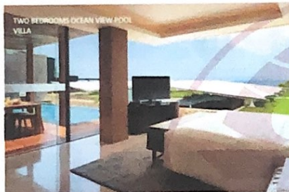
Gambar 9 Two Bedroom Ocean View Pool Villa