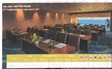
Gambar 7 Kapasitas Ruang Rapat Bali Biru