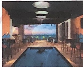
Gambar 2 Botol Biru Bar and Grill