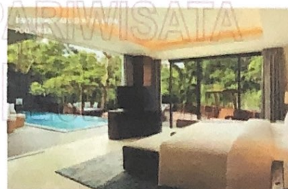
Gambar 6 Two Bedroom Garden View Pool Villa