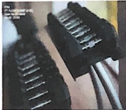
Gambar 4 Gym and Fitness Center