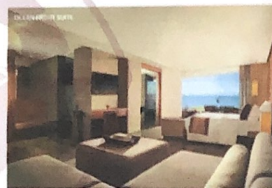
Gambar 4 Ocean Front Suite