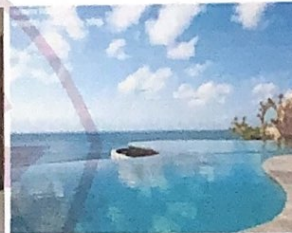
Gambar 6 Infinity Pool