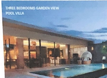
Gambar 7 Three Bedroom Garden View Pool Villa