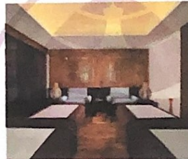
Gambar 5 Anantara Spa