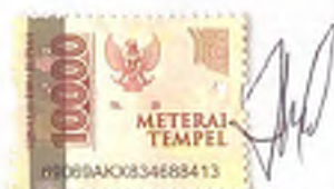
I GDE MADE SUKMA ADINATA