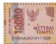
Made Fandy Darmasatya