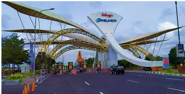
Gambar 3. Logo PT Pelindo (Persero) pada Gate Pelabuhan Benoa

Dalam hal ini, Pelabuhan Benoa sebagai BMTH perlu dibentuk sebagai brand untuk menunjukkan perbedaan Pelabuhan Benoa sebagai pelabuhan wisata dan sebagai pelabuhan pada umumnya. Menurut Kotler & Keller dalam (Rahmadhani, 2017:7) Brand Identity memiliki peranan yang sangat penting sebagai patokan dari program menyeluruh strategi dari suatu perusahaan, sebagai landasan dari sistem operasional suatu perusahaan, sebagai tiang dari jaringan ( network ) yang baik bagi perusahaan, alat jual dan promosi. Adapun dimensi yang semestinya ada pada Brand Identity BMTH antara lain :