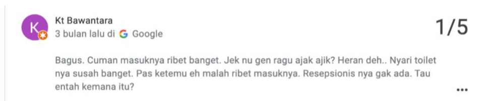
Gambar 1.2 Komentar negatif Kt Bawantara pada tanggal 30 Desember 2021