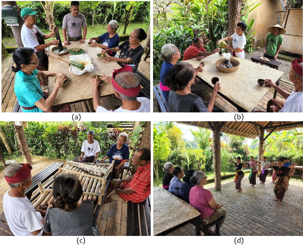
Gambar 3. Uji coba atraksi (a) “Jaje Lempog” cooking process, (b) tropical fruit tasting, (c) “Rindik” music, (d) children learning traditional dance show

Uji coba dilakukan berbasis observasi dan wawancara pada partisipan lansia yang mencoba produk dari hasil proyek yang ditunjukkan pada gambar 3. Uji coba ini dilakukan untuk mengetahui kemudahan atraksi wisata dari hasil produk proyek untuk dinikmati dan dapat diakses (aksesibel) oleh lansia.