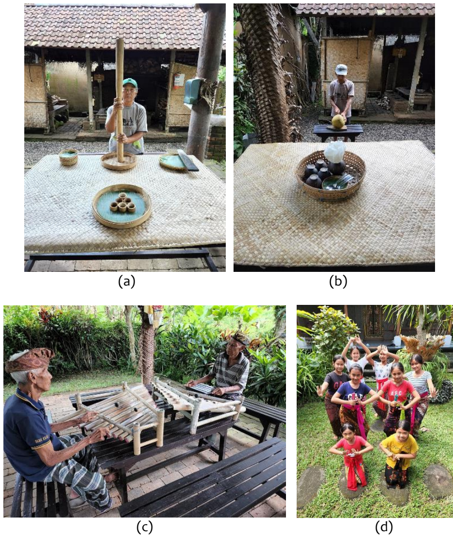
Gambar 2. Konstruksi atraksi (a) “Jaje Lempog” cooking process, (b) tropical fruit tasting, (c) “Rindik” music, (d) children learning traditional dance show

Atraksi yang dikembangkan berdasarkan 4 potensi hasil observasi sebelumnya ialah atraksi proses memasak kue “lempog”, aktivitas mencicipi buah – buahan tropis, permainan musik “rindik” dan pertunjukan tarian tradisional. Setelah ditentukan sumber daya manusia, alat dan bahan, kemudian dilakukan konstruksi produk atraksi wisata yang dapat dilihat pada Gambar 2.