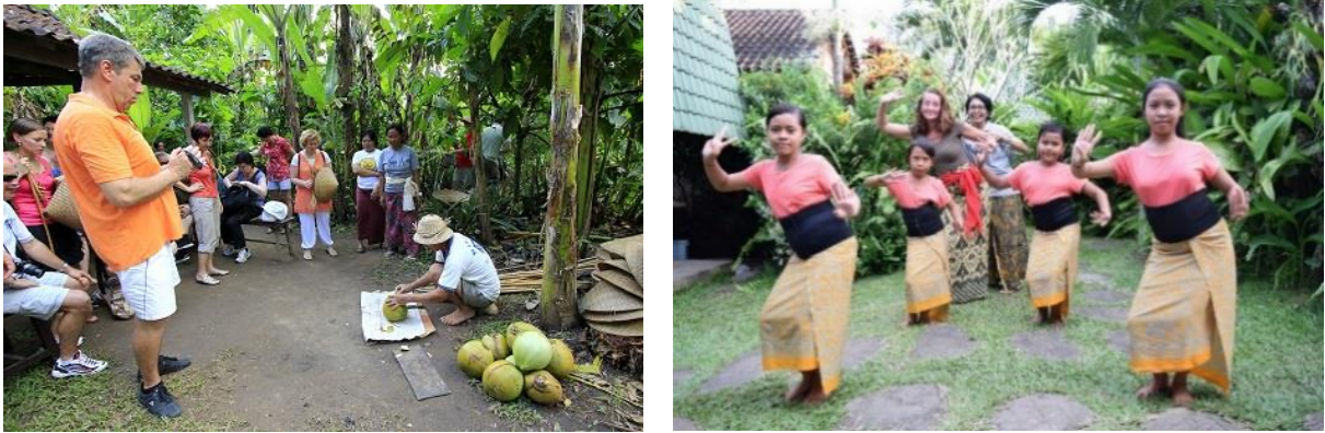
Gambar 1. Potensi – potensi atraksi wisata

Atraksi yang dikembangkan berdasarkan 4 potensi hasil observasi sebelumnya ialah atraksi proses memasak kue “lempog”, aktivitas mencicipi buah – buahan tropis, permainan musik “rindik” dan pertunjukan tarian tradisional. Setelah ditentukan sumber daya manusia, alat dan bahan, kemudian dilakukan konstruksi produk atraksi wisata yang dapat dilihat pada Gambar 2.