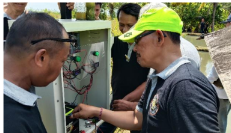
Gambar 1. Pelatihan Teori Pemasangan PLTS