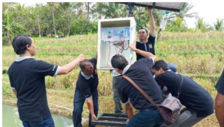
Gb. 7 Pembangkit Listrik Tenaga Surya

d. Faktor Pendorong dan Penghambat dalam Pelaksanaan PKM ini