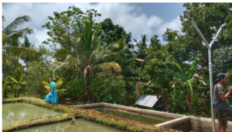
Gb. 6 Instalasi Penerangan

mewujudkan instalasi penerangan kolam pembesaran ikan. Instalasi penerangan dengan memanfaatkan lampu jalan dapat diperhatikan dalam gambar 6 di bawah ini. Sedangkan untuk system pembangkit listrik tenaga surya (PLTS) yang terdiri atas solar panel dan box panel dapat dilihat dalam gambar 7 dibawah ini. Cahaya lampu mengakibatkan banyak laron yang jatuh ke kolam dan jadi makanan ikan, sehingga ikan cepat besar.