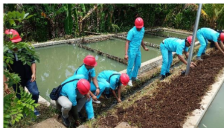
Gambar 3. Mahasiswa Praktik Instalasi

Dalam Gambar 1 dan 2 menunjukkan aktivitas pelatihan teori dan praktik pemasangan instalasi penerangan dan PLTS. Kepada anggota kelompok (berbaju putih) beberapa dosen (berbaju biru dongker) menjelaskan secara teoritis dengan memanfaatkan alat peraga PLTS sebelum dipasang diinstalasi di lokasi. Setelah penjelasan secara teoritis dilanjutkan dengan praktik pemasangan instalasi penerangan dengan memasang kabel tanam seperti ditunjukkan dalam gambar 2.