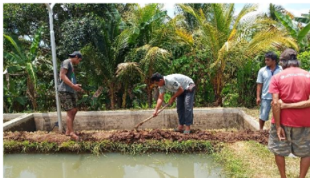
Gambar 2. Praktik Pemasangan Instalasi

Dalam Gambar 1 dan 2 menunjukkan aktivitas pelatihan teori dan praktik pemasangan instalasi penerangan dan PLTS. Kepada anggota kelompok (berbaju putih) beberapa dosen (berbaju biru dongker) menjelaskan secara teoritis dengan memanfaatkan alat peraga PLTS sebelum dipasang diinstalasi di lokasi. Setelah penjelasan secara teoritis dilanjutkan dengan praktik pemasangan instalasi penerangan dengan memasang kabel tanam seperti ditunjukkan dalam gambar 2.