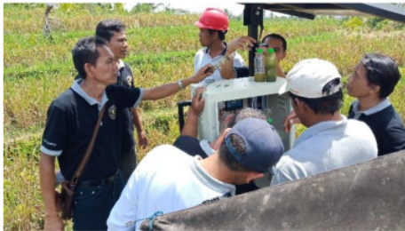
Gambar 4. Mitra Mengoperasikan PLTS

Dalam pelaksanaan kegiatan pengabdian kepada masyarakat saat ini, mahasiswa mengimplementasikan teori dan praktik simulasi yang diperolehnya di kampus dalam dunia nyata di lapangan, sebagaimana ditunjukkan dalam gambar 3 di atas. Tentu pelaksanaan dilapangan seperti ini akan memberi pengalaman baru bagi mahasiswa, karena tantangan dan hambatan berbeda dengan yang dialami saat simulasi di kampus. Untuk mencegah kecelakaan kerja, maka semua mahasiswa menggunakan alat keselamatan dan Kesehatan kerja yang memadai.