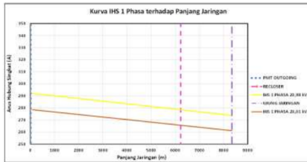
Gambar 2. Kurva Arus Gangguan Hubung Singkat 1 Fasa Penyulang Dalung

Setelah dilakukan perhitungan dan diperoleh hasil yang tertera pada Tabel 6, maka dapat dibuat kurva arus gangguan hubung singkat terhadap panjang jaringan dengan tegangan tertinggi dan terendah yang ditunjukkan pada Gambar 2 dan Gambar 3.