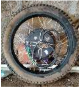
Gambar 4 Motor BLDC Setelah Dipasang Dengan Ban

sepeda motor listrik maksimum dengan motor listrik 2.000W. Motor BLDC dipilih karena memiliki banyak keunggulan yaitu, torsi yang bagus, efisiensi yang tinggi, memiliki ketahanan yang bagus dalam pemakaian lama, dapat bekerja optimal pada semua rentang putaran rpm. Dipilihnya tipe HUB atau tipe motor yang menjadi satu dengan pusat roda untuk mempermudah konstruksi kendaraan dan menghemat ruang yang tersedia.