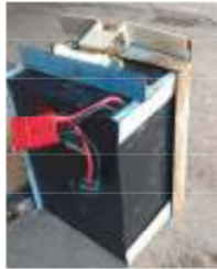
Gambar 6. Baterai Lithium Polymer 60 Volt 30 Ah

Sebagai bahan kimia, baterai tidak boleh digunakan sampai kapasitasnya habis, operasi seperti ini akan mempercepat kerusakan baterai(Chen, dkk; 2012). Baterai lithium polymer, tidak diperbolehkan untuk mengeluarkan hingga kapasitas 10%(Ranjbar, dkk; 2017). Dengan demikian baterai sebaiknya dioperasikan minimal hingga 20%. Dalam penelitian ini beban yang di suplai adalah motor listrik dengan daya 2.000W 60V. Arus motor BLDC berbanding terbalik terhadap tegangan dan kapasitas baterai yang dibutuhkan sangat dipengaruhi oleh waktu pemakaian baterai(Yantoro, 2019):