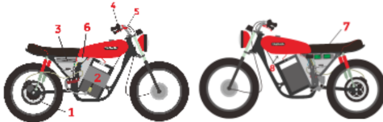
Gambar 1. Desain perencanaan tampak kanan dan kiri

Rem dengan Limit Switch Nomor, 6) MCB (Miniature Circuit Breaker) 7) kWh Meter Nomor, 8) Konverter Step Down DC-DC.