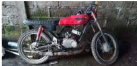
Gambar 1. Yamaha LS3 bermesin motor bakar

Sepeda motor bakar yang akan di konversi menjadi sepeda motor listrik disini adalah Yamaha LS 3 Tahun Pembuatan 1973, Isi Silinder: 100 CC.