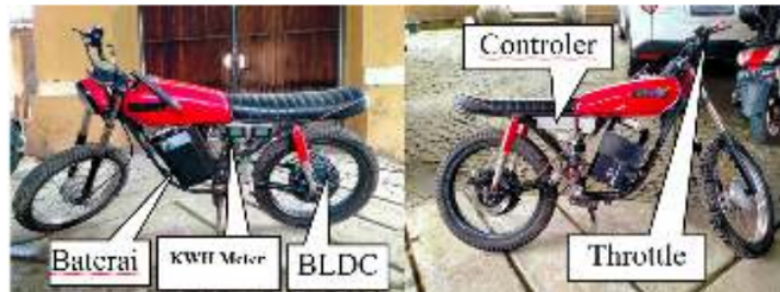
(a) Tampak Kiri

Penelitian ini menghasilkan sebuah sepeda motor listrik yang unik, dengan wajah yang tidak jauh berbeda dengan wajah sebelumnya. Setelah konversi sepeda motor listrik ini hanya seberat 79 kg. Gambar di bawah ini menunjukkan sepeda motor listrik lengkap dengan baterai, BLDC motor, throttle gas, controler dan kwh meter.