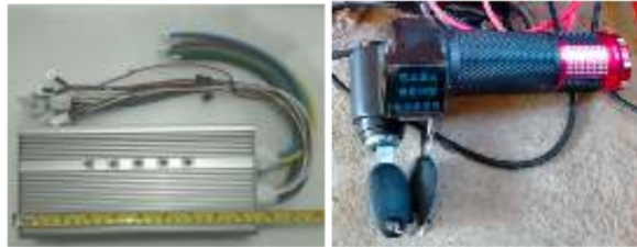
Gambar 5. Controller BLDC 4.800W dan throttle gas

Handle Gas/ Throttle Gas berfungsi sebagai pengatur kecepatan motor BLDC dengan menghasilkan denyut sinyal PWM sesuai dengan putaran handel gas, yang akan diteruskan menuju controller . Handle Gas yang dipilih adalah tipe universal standar yang dilengkapi dengan indikator tegangan baterai dan kunci kontak untuk mengoperasikan controler .