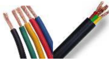
(a) NYAF (b) NYHY