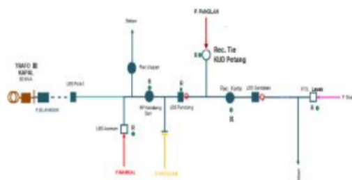
Gambar 3.1 Single Line Diagram Penyulang Blahkiuh Penyulang ini akan dibedakan menjadi dua sistem operasi pada penelitian ini, yaitu dengan menggunakan sistem radial serta sistem loop scheme kedua koordinasi kerja pada sistem tersebut akan dijabarkan sebagai berikut :

Merupakan suatu metode untuk menganalisa bagaimana pengaruh penggunaan sistem loop scheme pada JTM 20 kV penyulang Blahkiuh terhadap tingkat keandalan sistem. Dengan membandingkan tingkat keandalan sistem (SAIDI / SAIFI) pada penyulang Blahkiuh dengan menggunakan dua konfigurasi jaringan yaitu sistem loop scheme dan sistem radial. Dimana pada metode ini akan dilakukan analisa hasil perhitungan SAIDI dan SAIFI pada penyulang Blahkiuh dengan sistem loop scheme dan sistem radial untuk mengetahui apa pengaruh dari digunakannya sistem loop scheme pada JTM 20 KV Penyulang Blahkiuh.