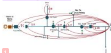
Gambar 3.3 Koordinasi Kerja Sistem Radial pada Penyulang Blahkiuh

Sistem radial merupakan suatu bentuk jaringan distribusi yang ditarik secara radial dari suatu titik yang merupakan sumber dari jaringan dan kemudian dicabang – cabangkan ke titik – titik beban yang dilayani. Pada penyulang blahkiuh ini koordinasi kerja sistem radial adalah sebagai berikut :