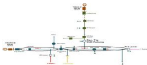
Gambar 3.2 Koordinasi Kerja Sistem Loop Scheme pada Penyulang Blahkiuh

- Apabila terjadi gangguan pada seksi I, maka Blahkiuh akan mencoba reclosed kembali. Apabila gangguannya bersifat sementara maka jaringan akan normal kembali. Tetapi apabila gangguannya bersifat permanen maka penyulang Blahkiuh akan trip kembali dan lockout . Setelah penyulang Blahkiuh trip dan lockout penyulang Blahkiuh akan trip, sehingga seksi I dan seksi II akan kehilangan tegangan. Setelah sesuai dengan settingan waktu di GI yaitu 4 detik maka penyulang maka 10 detik kemudian recloser feeder Kembang Sari akan trip karena merasakan kehilangan tegangan. Setelah recloser feeder Kembang Sari trip maka recloser tie KUD Petang akan merasakan kehilangan tegangan sehingga menutup ( closed ) dalam selang waktu 20 detik. Setelah recloser tie KUD Petang menutup maka penyulang Panglan masuk untuk mensuplai tegangan pada penyulang Blahkiuh yang tidak mengalami gangguan. Sehingga dengan koordinasi loop scheme ini daerah padam pada penyulang Blahkiuh akan dapat dilokalisir sehingga jumlah pelanggan yang padam dapat diminimalisir.