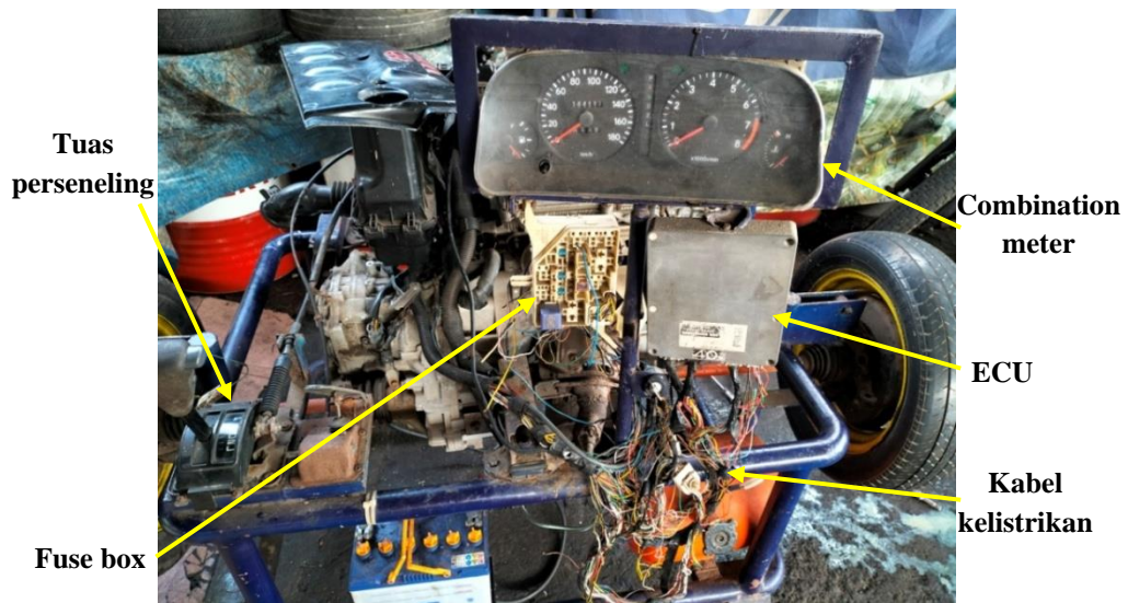
Gambar 1.1 Kondisi Engine Trainer Sebelum di Rekondisi

dipergunakan untuk praktek. Seperti halnya engine trainer injeksi Toyota Vios Seri 2NZ – FE yang sudah tidak dapat beroperasi karena berbagai kerusakan.