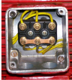
1 Gambar 2. Box terminal motor induksi 3 fasa

Penggunaan motor induksi 3 fasa paling banyak digunakan sebagai penggerak pada industri-industri. Pada pengoperasian motor induksi tiga fasa menurut (PUIL, 2000 ) kapasitas motor di bawah 5 KW bisa dihubungkan langsung ke suplai (sistem DOL). Sedangkan yang dayanya diatas 5 KW harus menggunakan alat bantu start, karena arus start motor induksi sangat besar (2 s/d 7 x I n). [7], [8]