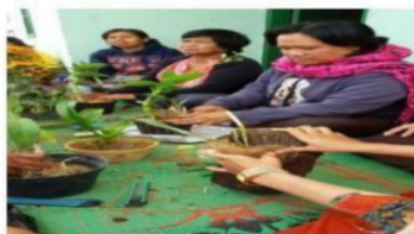
Gambar 1. Pelatihan Manajemen

Disamping itu juga diberikan pelatihan tentang pembuatan pot tanaman, penataan dahan dan ranting, pembuatan pupuk organik, batu taman, rerumputan, dan hidroponik. Jenis tanaman baru seperti anting putri, bonsai beringin jenis iprik, kimeng, kompakta, dan dollar. Ada cemara, anting putri, sakura, putri salju, soka, melati, lohansung, marten, hokiantea, dan masih banyak jenis lainnya yang ada [4].