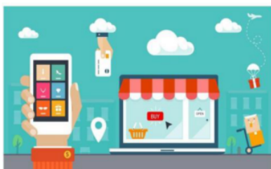
Gambar 5. Sistem Informasi dengan Digital Marketing