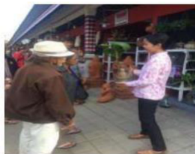
Gambar 2. Pemasaran pada Wisatawan

Peningkatan manajemen dengan memberikan pelatihan jobdesk manajemen perkantoran antara direktur, manajer, business development , staf IT dan helper , pengelolaan keuangan perkantoran termasuk investasi, skala prioritas dan kalkulasi untung rugi, pengoperasian komputer perkantoran ( office ), hingga pemanfaatan modal yang ada agar bisa diputar dan dikembangkan.