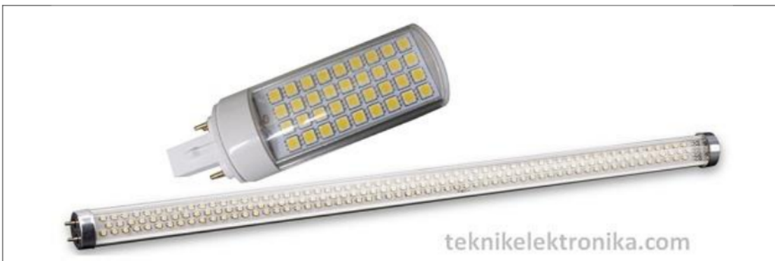
Gambar 4. Lampu LED

Lampu ini merupakan sirkuit semikonduktor yang memancarkan cahaya ketika dialiri listrik. Sifatnya berbeda dengan filamen yang harus dipijarkan (dibakar) atau lampu TL yang merupakan pijaran partikel. Lampu LED memancarkan cahaya lewat aliran listrik yang relatif tidak menghasilkan banyak panas. Karena itu lampu LED terasa dingin dipakai karena tidak menambah panas ruangan seperti lampu pijar. Lampu LED juga memiliki warna sinar yang beragam, yaitu putih, kuning, dan warna-warna lainnya.