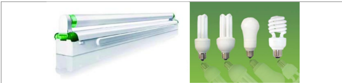
Gambar 2. Lampu TL

Jenis lampu ini juga dikenal dengan lampu neon 4 . Dewasa ini lampu neon bentuknya bermacam-macam, ada yang bentuknya memanjang biasa, bentuk spiral atau tornado, dan ada juga yang bentuk memanjang vertikal dengan fitting (bentuk pemasangan ke kap lampu) yang mirip seperti lampu pijar biasa. Lampu TL lebih hemat energi dibandingkan lampu pijar, karena lebih terang. Untuk lampu TL yang baik (merk bagus), bisa bertahan 15.000 jam atau setara dengan 10 tahun pemakaian, harganya juga sekitar 10x lampu pijar biasa.