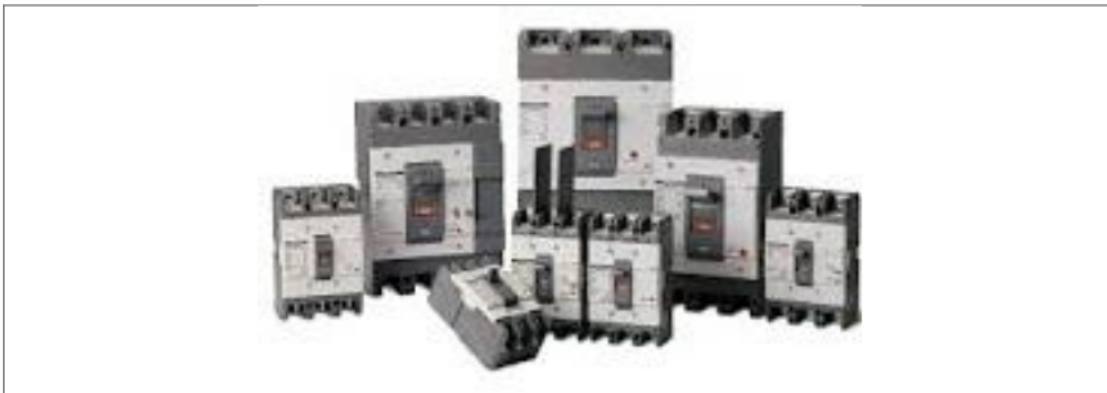
Gambar 8. MCCB

3 MCCB Adalah pemutus sirkuit tegangan menengah. Dalam memilih circuit breaker hal-hal yang harus dipertimbangkan adalah sebagai berikut: