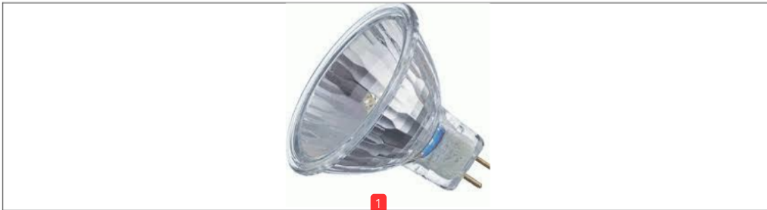
Gambar 3. Lampu Halogen

Lampu jenis ini merupakan lampu spot yang baik. Lampu spot adalah lampu yang cahayanya mengarah ke satu area saja, misalnya lampu untuk menerangi benda seni secara terfokus. Lampu ini baik untuk digunakan sebagai penerangan taman untuk membuat kesan dramatis dari percahayaan terpusat seperti menerangi patung, tanaman, kolam atau area lainnya. Jenis lampu ini sebenarnya merupakan lampu filamen yang sudah berhasil dikembangkan menjadi lebih terang, namun juga kebutuhan energi (watt) yang relatif sama.