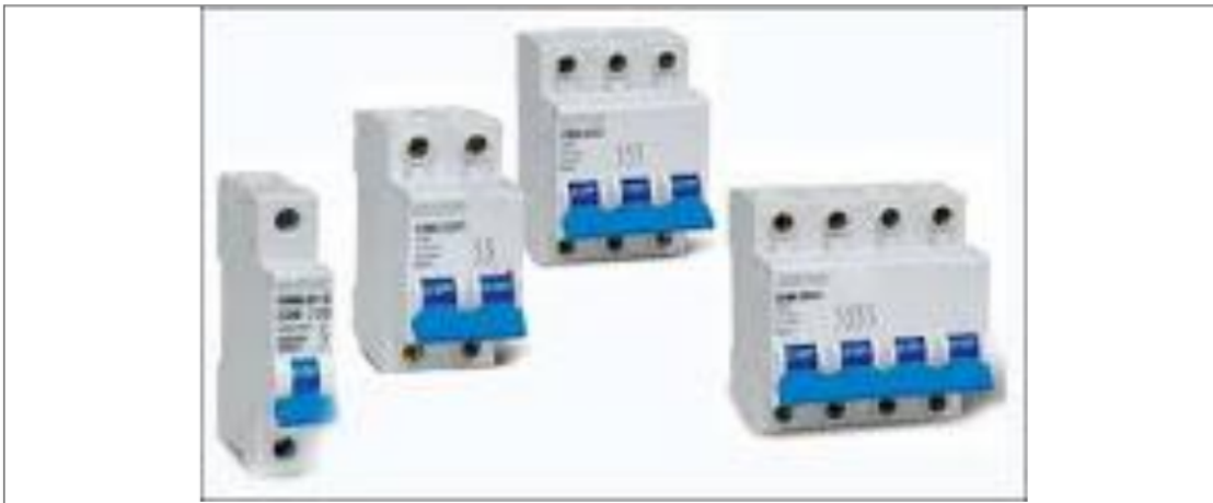
Gambar 7. MCB

2 MCB adalah suatu peralatan pemutus rangkaian listrik pada suatu sistem tenaga listrik, yang mampu untuk membuka dan menutup rangkaian listrik pada semua kondisi, termasuk arus hubung singkat, sesuai dengan ratingnya. Juga pada kondisi tegangan yang normal ataupun tidak normal.