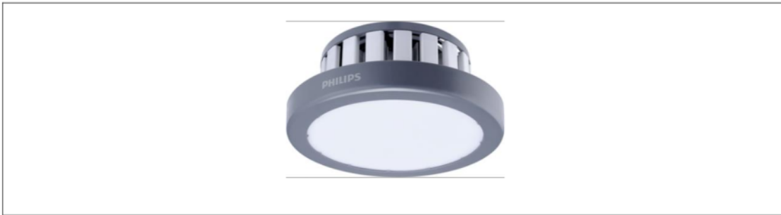
Gambar 6. Lampu LED 100 watt