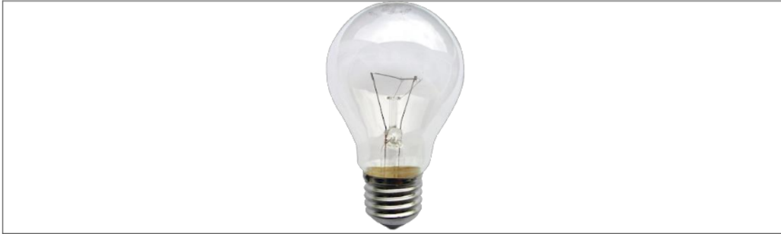
Gambar 1. Lampu Pijar

mendapatkan tingkat terang yang sama. Lampu pijar atau bohlam biasa ini hanya bertahan 1000 jam atau untuk rata-rata pemakaian 10 jam sehari semalam, hanya bertahan kira-kira 3 - 4 bulan, dan setelah itu kita harus membeli bohlam baru.