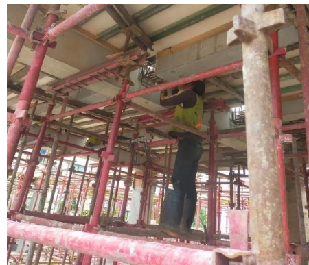
Pekerjaan Pembesian Joint