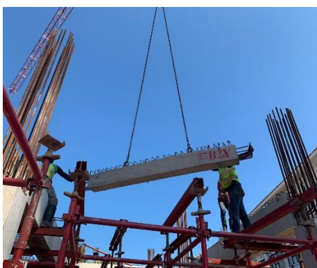
Pekerjaan Erection Balok