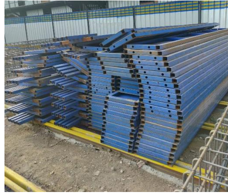
Pekerjaan Bekesting (Pabrikasi)