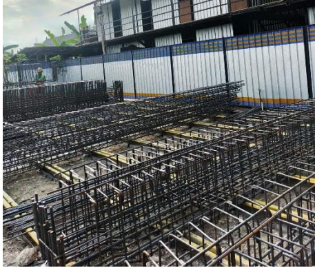
Pekerjaan Pembesian (Pabrikasi)