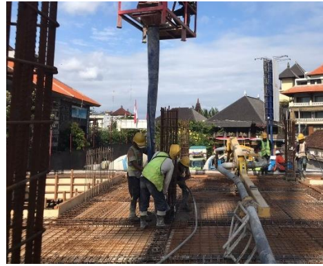
Pekerjaan Beton Sambungan