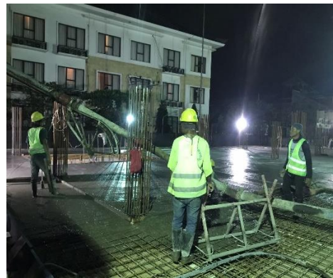
Pekerjaan Pengecoran Balok