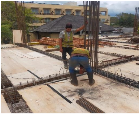
Pekerjaan Pembesian Atas