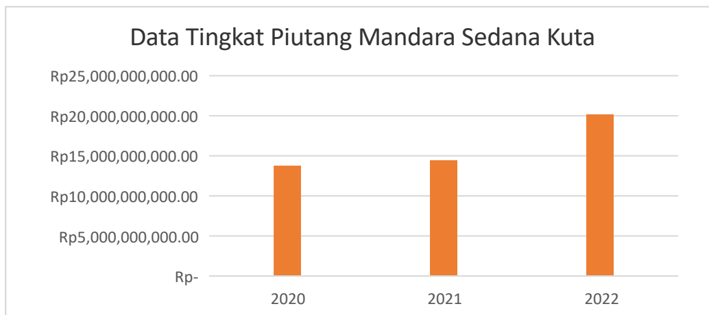
Grafik 1.1 Data Tingkat Piutang Koperasi Mandara Sedana Kuta Dalam Tahun Buku 2020, 2021, dan 2022