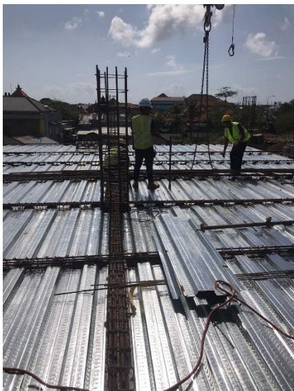
Pemasangan bekisting plat lantai