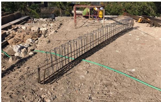
Pembesian balok precast